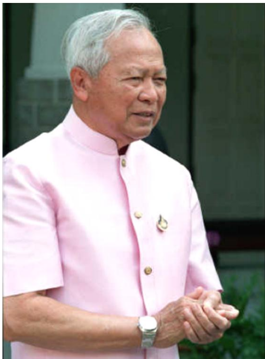
พลเอกเปรม ติณสูลานนท์ ก่อตั้ง ปี พ.ศ. 2528

ภารกิจ: ความมั่นคงด้านพลังงาน สร้างเสริมคุณภาพชีวิตที่ดีของสังคมไทย