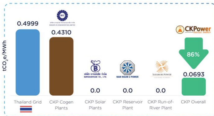
Source: Thailand Electricity Grid Emission: THSMTEC-NSTDA, AR5 with TGO electricity 2016-2018 Latest version (Remarks: Data as of 2023)