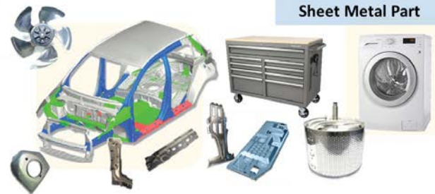
Sheet Metal Part