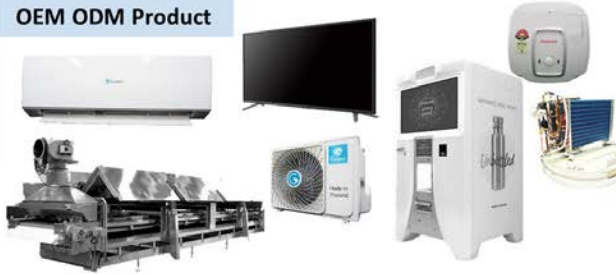
OEM ODM Product

เมื่อวิกฤต COVID-19 เริ่มมีสัญญาณที่อาจจะกระทบผลการดำเนินงานและชีวอนามัยของผู้ที่เกี่ยวข้อง บริษัทได้กำหนดให้ Mini MD Team และ SCM Department ติดตามแผนธุรกิจและข้อมูลสถานการณ์ของ Supplier อย่างใกล้ชิด เพื่อปรับเปลี่ยนแผนธุรกิจประสานข้อมูลกับทางฝ่าย SCM อย่างใกล้ชิดในการติดต่อปรับเปลี่ยนแผนในการจัดหาวัตถุดิบจาก Supplier ทั้งในประเทศและต่างประเทศ รวมถึงสรรหาแหล่งวัตถุดิบสำรองเพื่อป้องกันผลกระทบที่อาจเกิดขึ้น อีกทั้งได้กำหนดมาตรการในการดูแลพนักงานและพื้นที่โรงงาน โดยกำหนดจุดคัดกรองผู้มาติดต่อและพนักงานก่อนเข้าพื้นที่โรงงานและมีการจัดหาอุปกรณ์สำหรับพนักงาน เช่น หน้ากากอนามัย เจลแอกอฮอล์ทำความสะอาด จุดล้างมือสำหรับพนักงาน มีการทำความสะอาดฆ่าเชื้อโรคในพื้นที่โรงงาน เป็นต้น