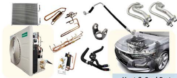
Heat & Cool Part