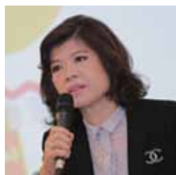
คุณเกศรา บัญชูศรี กรรมการและผู้จัดการ ตลาดหลักทรัพย์แห่งประเทศไทย (SET)

“หลักการและแนวปฏิบัติด้าน CG ถือเป็นรากฐาน ความแข็งแกร่งของธุรกิจที่จะนำพาธุรกิจสู่ความยั่งยืน”