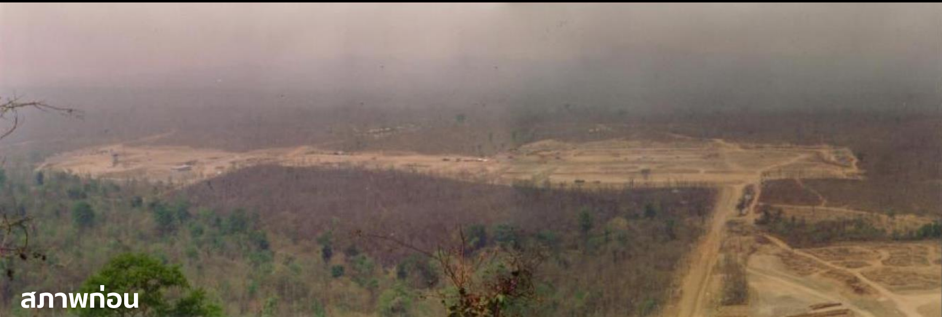
สภาพก่อน