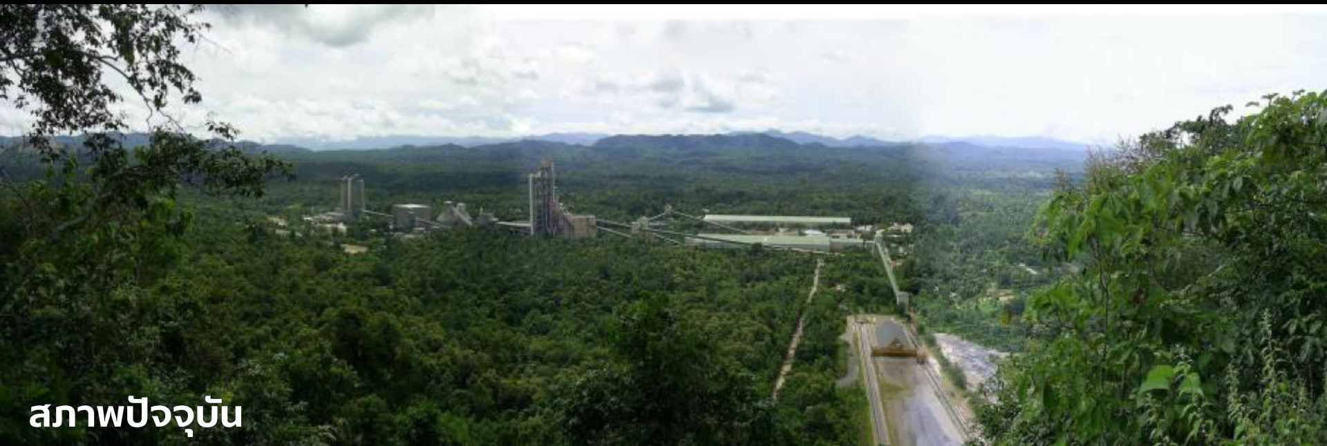
สภาพปัจจุบัน