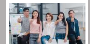
ชุดความรู้ ESG สำหรับพนักงาน