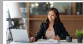
ชุดความรู้ ESG สำหรับเลขานุการบริษัท