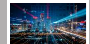
ชุดความรู้ ตามรอยอุตสาหกรรม