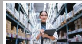
ชุดความรู้ SUPPLY CHAIN MANAGEMENT