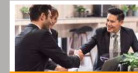
ชุดความรู้ ESG สำหรับนักลงทุนสัมพันธ์