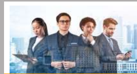
ชุดความรู้ ESG สำหรับคณะกรรมการ