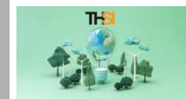
ชุดความรู้ การประเมินหุ้นยั่งยืน THSI