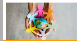
ชุดความรู้ ธุรกิจกับสิทธิมนุษยชน