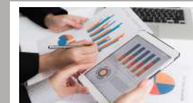
ชุดความรู้ การจัดทำ ONE REPORT