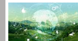
ชุดความรู้ การประเมินความยั่งยืนในระดับสากล