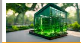
ชุดความรู้ ธุรกิจกับการจัดการก๊าซเรือนกระจก