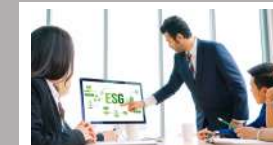
ชุดความรู้ การยกระดับการรายงาน SUSTAINABILITY REPORT