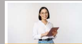
ชุดความรู้ ESG สำหรับ ESG Professional