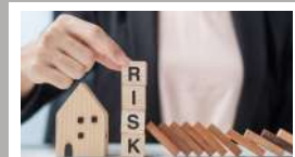
ชุดความรู้ ESG RISK ASSESSMENT